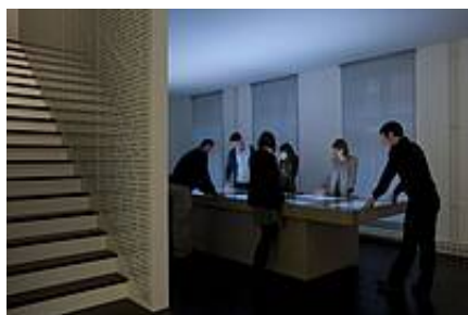
„Cisi bohaterowie” / "Stille Helden"