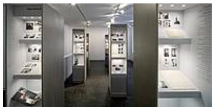
„Cisi bohaterowie” / "Stille Helden"