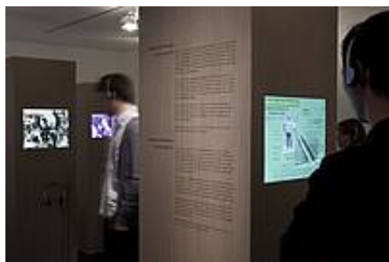
„Cisi bohaterowie” / "Stille Helden"