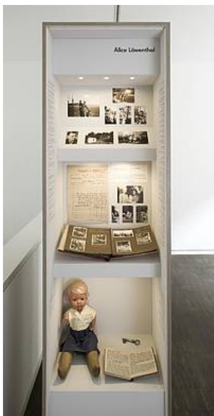
„Cisi bohaterowie” / "Stille Helden"