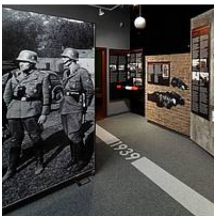
Krakowianie wobec terroru